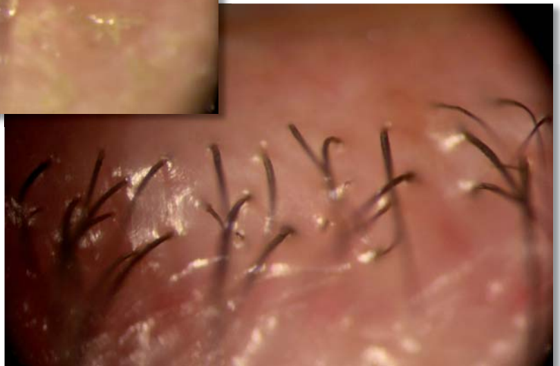
Zustand nach der Behandlung mit BlephEx ▷