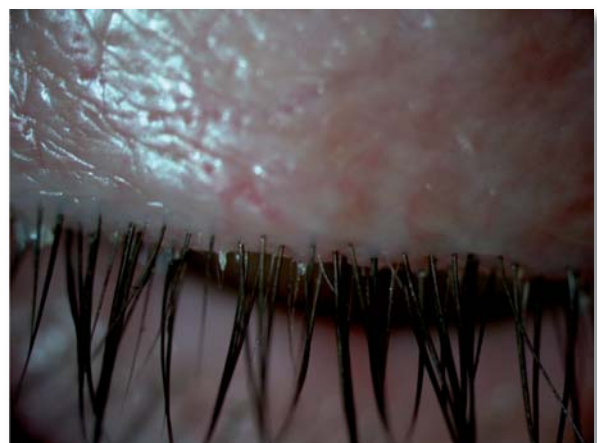
△ Zustand nach der BlephEx Behandlung