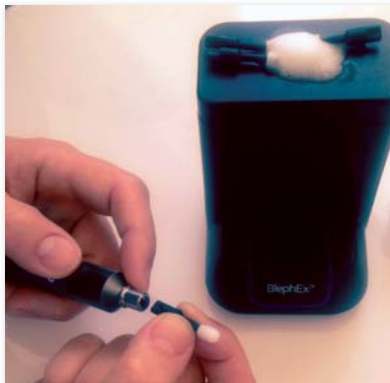
△ Ladestation mit Behälter für Reinigungsflüssigkeit